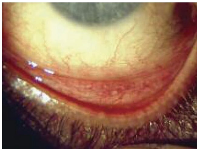
Рис. 2: Токсический блефароконъюнктивит – едва различимая, но симптоматичная гиперемия конъюнктивы с фолликулярной реакцией

ной кислоты (ЭДТА) приводили к задержке заживления роговицы, а БАХ в концентрации 0,02% полностью подавлял процесс заживления после кератэктомии на глазах кроликов. 20 В исследовании, выполненном на собаках, 0,0025% БАХ или 0,025% тиомерсал подавляли рост псевдоподий эпителиальных клеток и препятствовали регенерации эпителия роговицы. 21 Что касается людей, то имеется несколько опубликованных отчетов о случаях токсического воздействия на роговицу связанного с БАХ у пациентов при ношении контактных линз, 22 а также у пациентов в раннем послеоперационном периоде после операции по поводу катаракты 23 и у лиц с синдромом «сухого глаза» 24,25 . Важно отметить, что симптомы у этих пациентов исчезали после того, как глазные капли, содержащие консерванты, заменяли препаратами без консервантов.